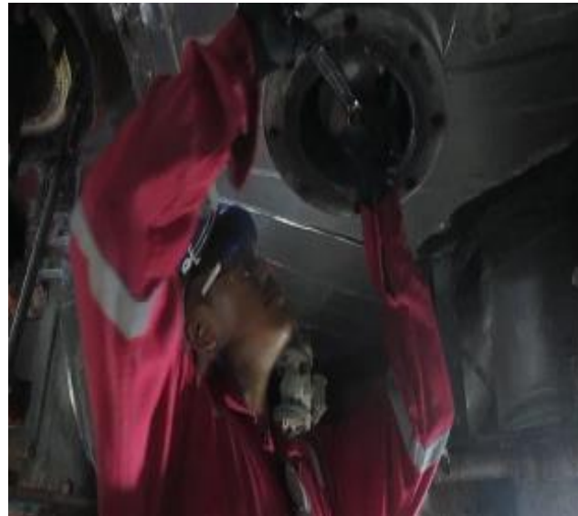
INSTALACIÓN DE ANODO NUEVO