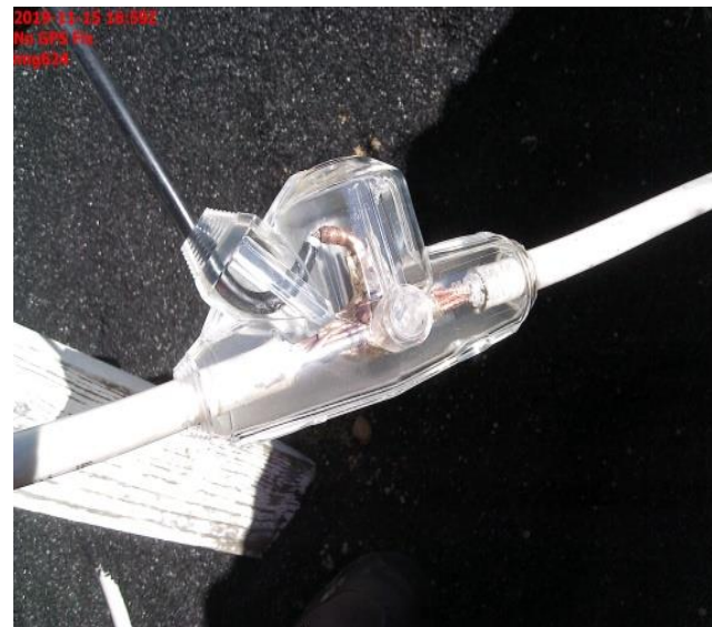
MOLDE PARA RESINA