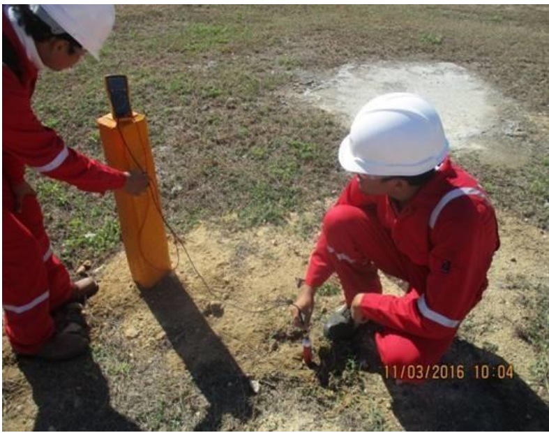
MONITOREO DE POTENCIALES