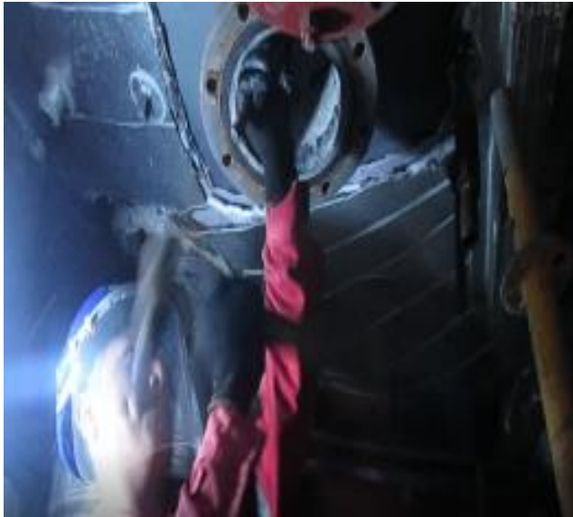
RETIRO DE ANODO