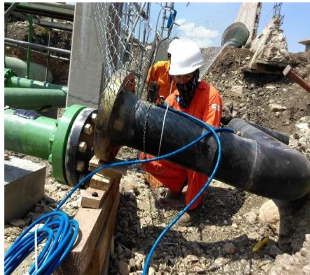
PUNTEO CON TUBERÍA DE PLANTA