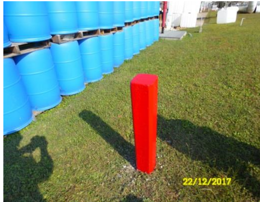
PINTADO DE POSTE

Reparación de postes de monitoreo de protección catódica