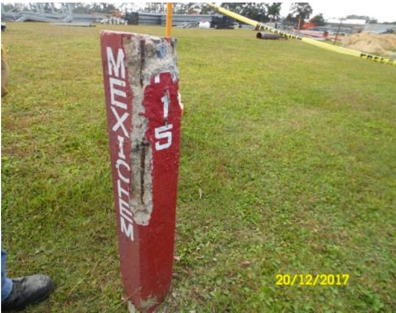
POSTE DE P.C EN MAL ESTADO