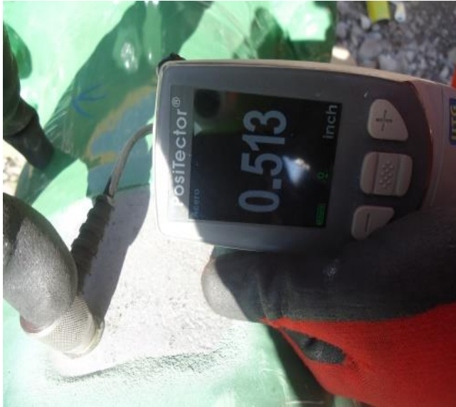
MEDICIÓN DE ESPESOR DE TUBERÍA