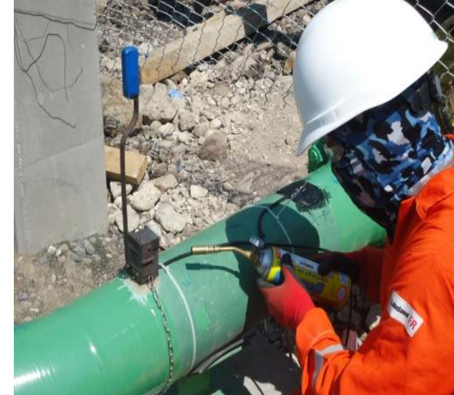
PRECALENTAMIENTO PARA ELIMINACIÓN DE HUMEDAD