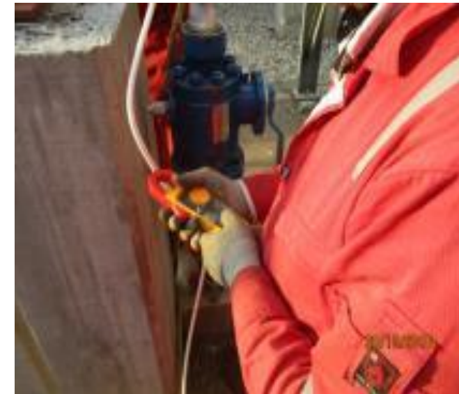
VERIFICACIÓN DE CORRIENTE