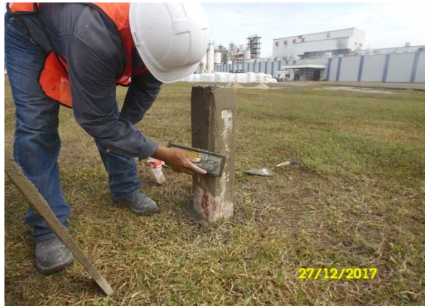
REPARACIÓN DE POSTE