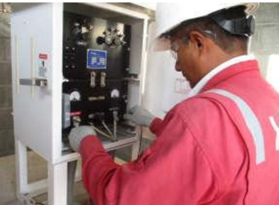
MONITOREO DE RECTIFICADOR