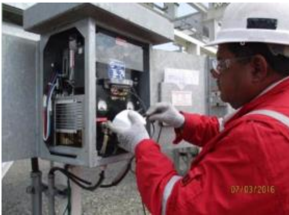
MONITOREO DE RECTIFICADOR