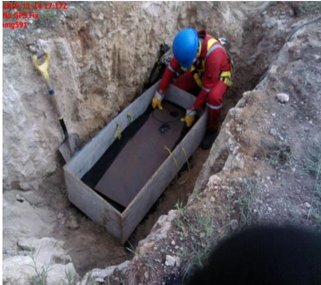
INSTALACIÓN DE PLACAS PARA SIMULACIÓN