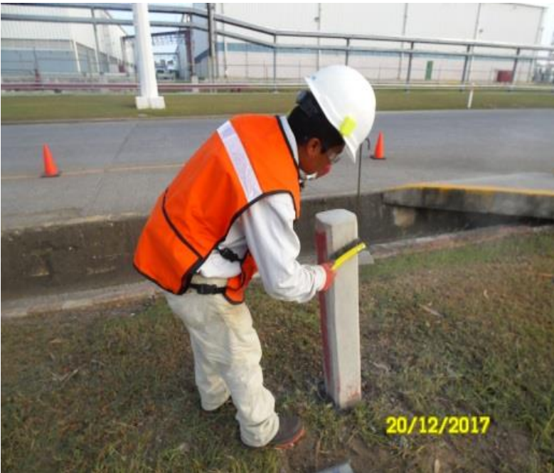
REPARACIÓN DE POSTE