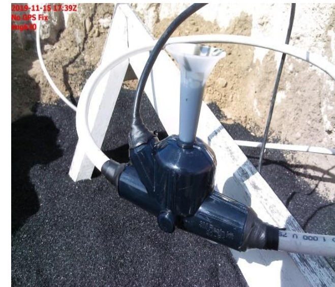
MOLDE CON RELLENO DE RESINA