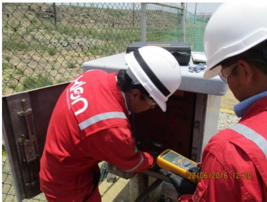
MONITOREO DE RECTIFICADOR