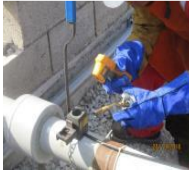
PRECALENTAMIENTO PARA ELIMINACIÓN DE HUMEDAD