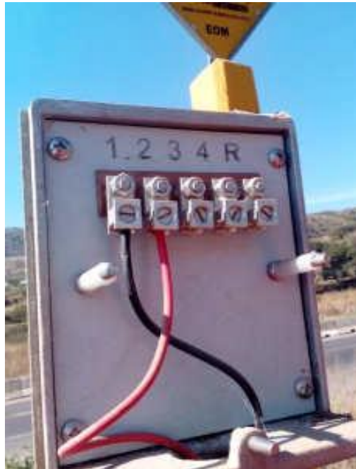
MONITOREO DE JUNCTION BOX