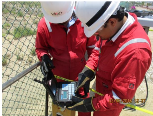
PROGRAMACIÓN DE SWITCH INTERRUPTOR