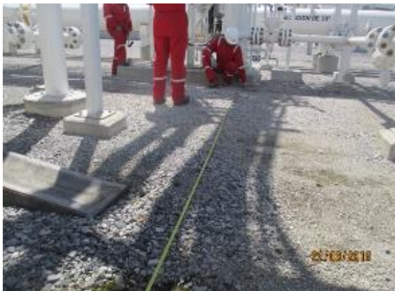
UBICACIÓN DE TUBERÍA