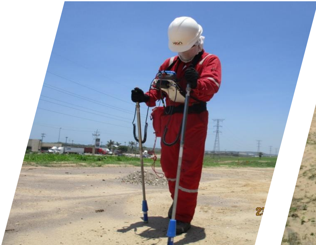
ESTUDIO CIS EN DERECHO DE VIA