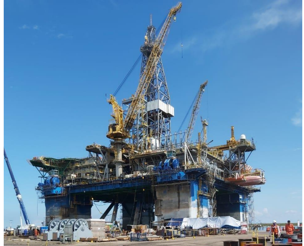
Supervisión de Proyecto FRIDA – Altamira, Tamps.