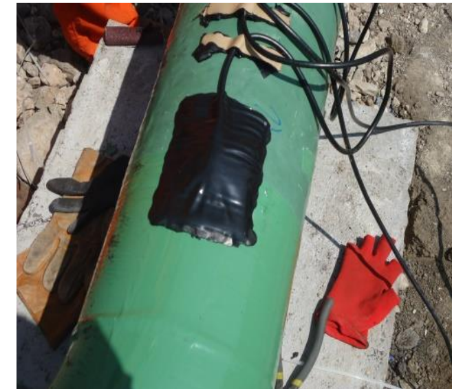
PROTECCIÓN CON CINTA VULCANIZADA