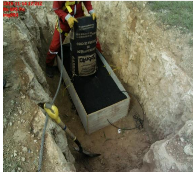
RELLENO DE COKE PARA MEJOR CONDUCCIÓN