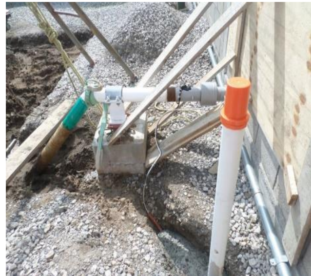
POSTE DE MEDICIÓN