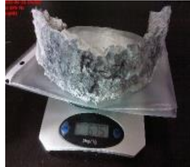
REGISTRO DE PERDIDA DE MATERIAL