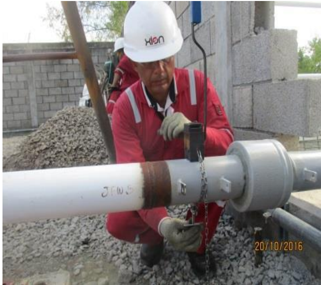
COLOCACIÓN DE MOLDE