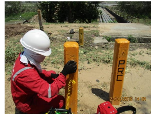
TOMA DE REGISTRO

Estudios CIS, Inspección de fuga de corriente