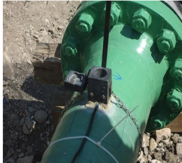
COLOCACIÓN DE MOLDE