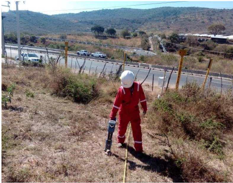
SONDEO DE TUBERÍA ENTERRADA