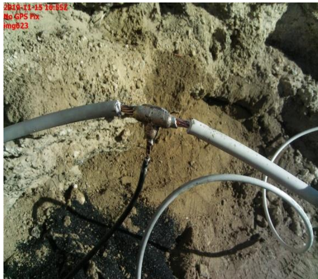
CONEXIÓN A RECTIFICADOR