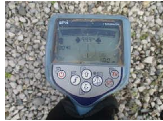
UBICACIÓN DE TUBERÍA