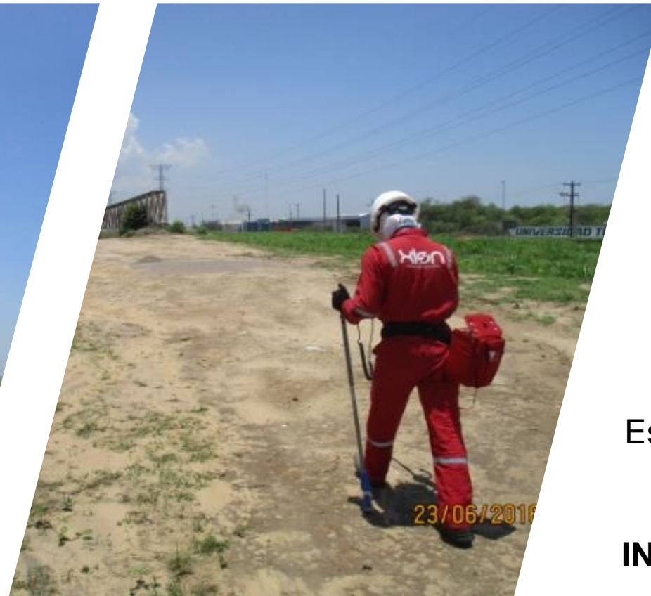
ESTUDIO CIS EN DERECHO DE VIA