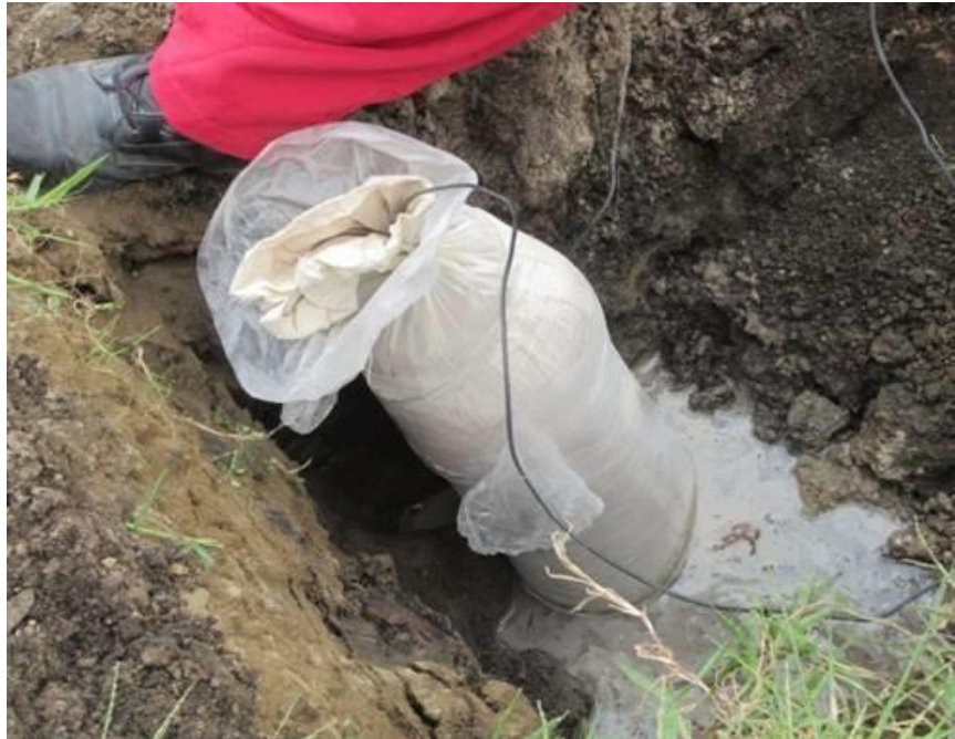
INSTALACIÓN DE ANODO DE SACRIFICIO

Estudios CIS, toma de potenciales, detención de líneas e instalación de ánodos en