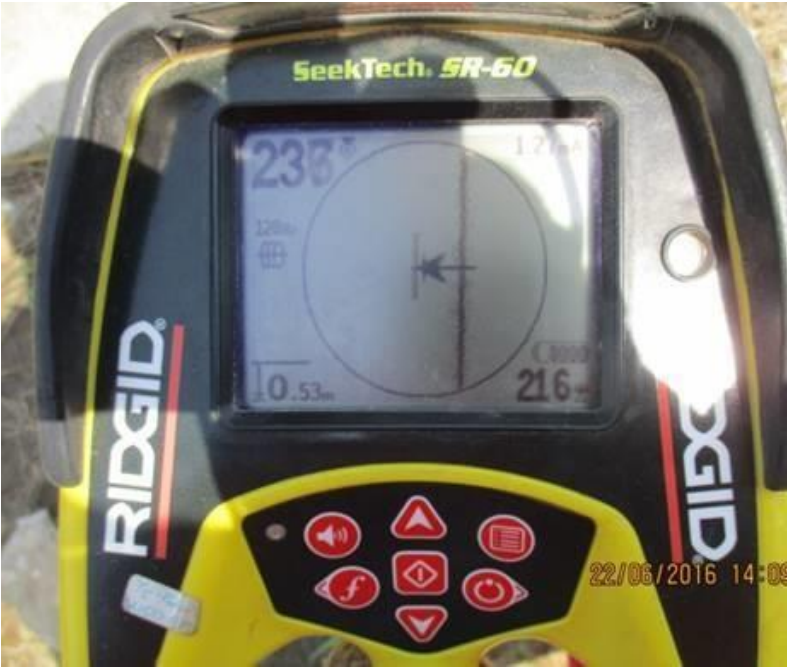
UBICACIÓN DE TUBERÍA ENTERRADA