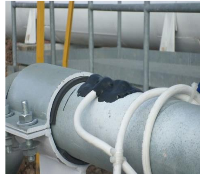
PROTECCIÓN CON CINTA VULCANIZADA